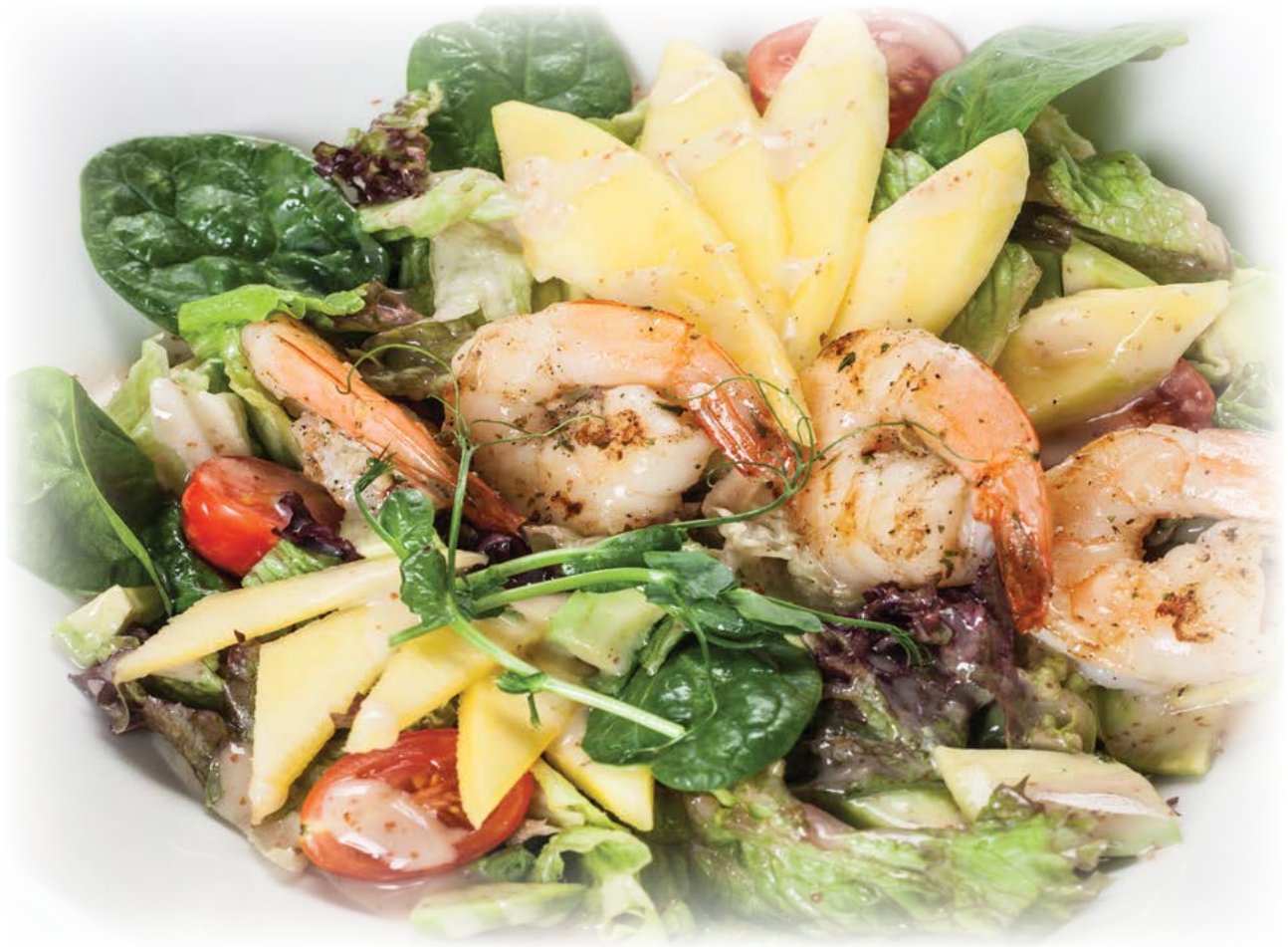
Shrimp salad / Салат из креветок