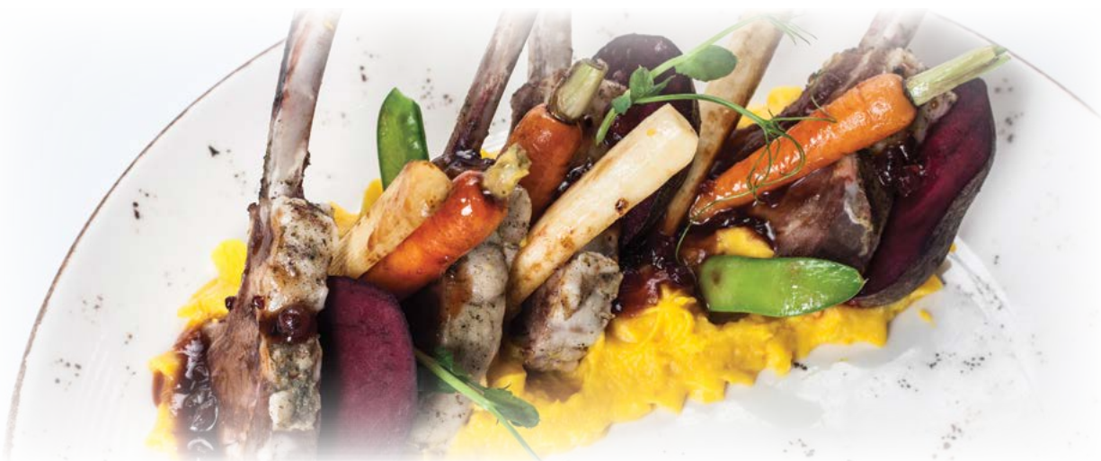
Lamb ribs marinated with thyme / Ребрышки ягненка, маринованные в тимьяне

Served with green butter, tomato and green herb sauce, green beans fried in garlic butter, pickled vegetables, Belgian fries / Подается с зеленым маслом, томатным соусом и соусом из зеленых трав, стручковой фасолью, обжаренной в чесночном масле, маринованными овощами,