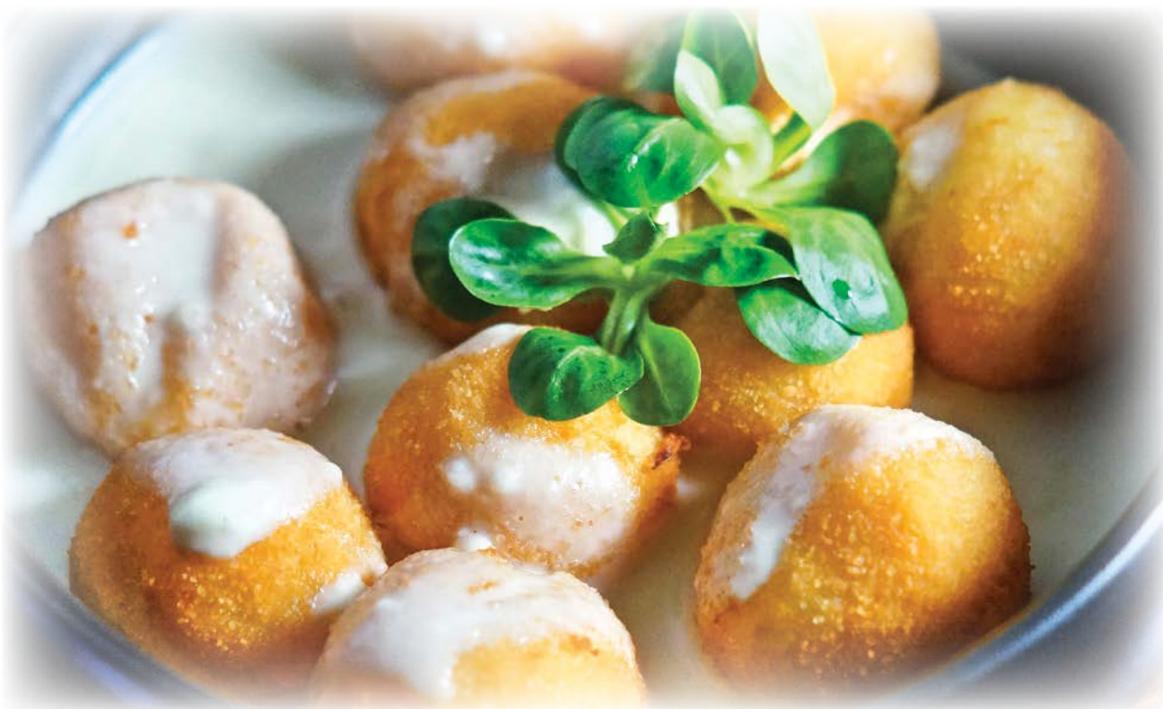
Potato dumplings stuffed with cheese / Картофельные галушки с сырной начинкой

Grated potato with chicken thigh 15,90 € Слоеный картофельный пирог со куриной ветчиной Best for 4 persons / Рекомендуемый на 4-ех Served with cracklings and onion sauce, sour cream Подается с подливой со шкварками и луком, со сметаной After ordering, you may need to wait 60 minutes. Заказ необходимо ждать 60 мин.