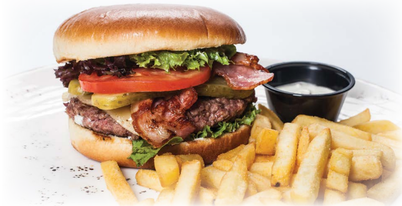
Burger with beef / Бургер с говядиной

Please inquire the servicing personnel regarding information about the allergens or substances that cause intolerance as well as GMO contained in the dishes Информацию о содержащихся в составе блюд аллергенах либо веществах, не воспринимаемых организмом, и ГМО, Вы можете получить у обслуживающего персонала