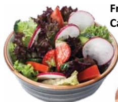
Fresh vegetable salad Салат из свежих овощей

With stewed cabbage, pickled cucumbers, tomatoes, fried potatoe and horseradish sauce С тушеной капустой, помидоры, соленые огурцы,