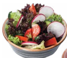
Fresh vegetable salad Салат из свежих овощей

Served with potato slices, carrot salad, fresh cucumbers Подается с ломтиками картофеля, морковным салатом, свежими огурцами