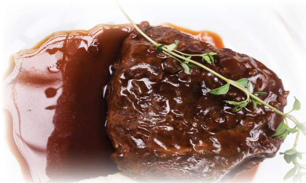
Beef jaws / Говяжьи челюсти