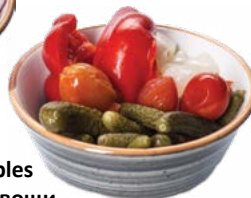
Marinated vegetables Маринованные овощи