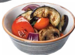
Grill Vegetables Овощи на гриле