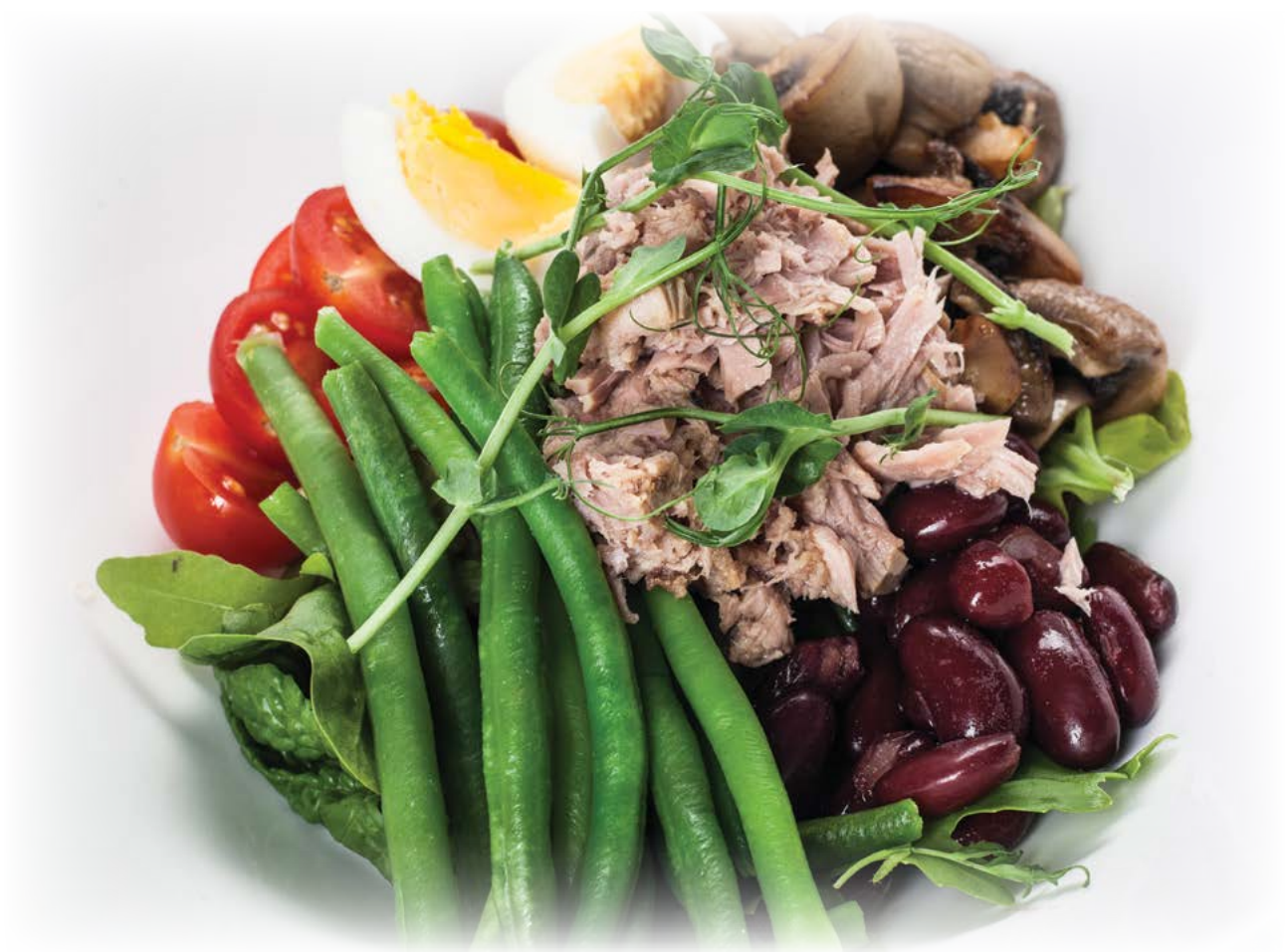
Nice salad with canned tuna / Салат «Ницца» с консервированным тунцом

Please inquire the servicing personnel regarding information about the allergens or substances that cause intolerance as well as GMO contained in the dishes Информацию о содержащихся в составе блюд аллергенах либо веществах, не воспринимаемых организмом, и ГМО, Вы можете получить у обслуживающего персонала