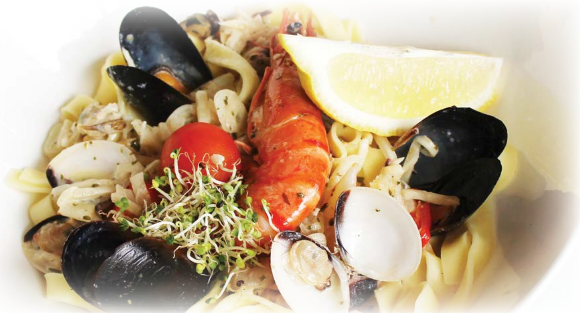
With seafood / С дарами моря

Please inquire the servicing personnel regarding information about the allergens or substances that cause intolerance as well as GMO contained in the dishes Информацию о содержащихся в составе блюд аллергенах либо веществах, не воспринимаемых организмом, и ГМО, Вы можете получить у обслуживающего персонала