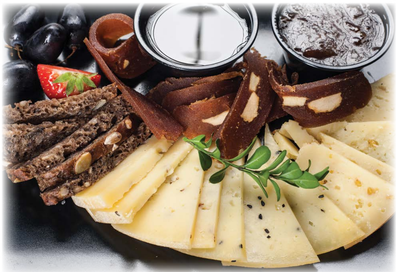
Set of Lithuanian ripened cheeses / Ассорти из литовских выдержанных сыров

Please inquire the servicing personnel regarding information about the allergens or substances that cause intolerance as well as GMO contained in the dishes Информацию о содержащихся в составе блюд аллергенах либо веществах, не воспринимаемых организмом, и ГМО, Вы можете получить у обслуживающего персонала