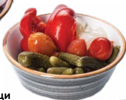
Marinated vegetables Маринованные овощи