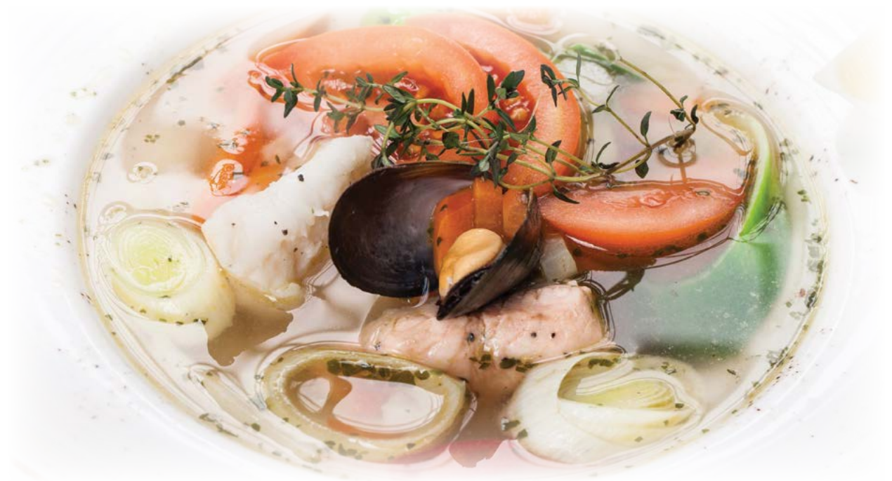
Fish soup / Рыбный суп