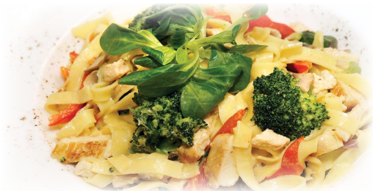
With chicken / С курицей