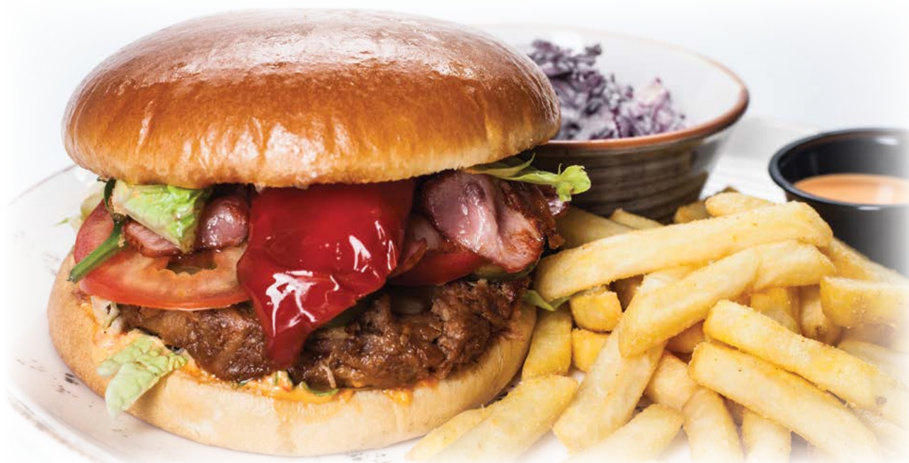
Burger with “Pulled Pork” / Бургер с рваным мясом «Pulled Pork»