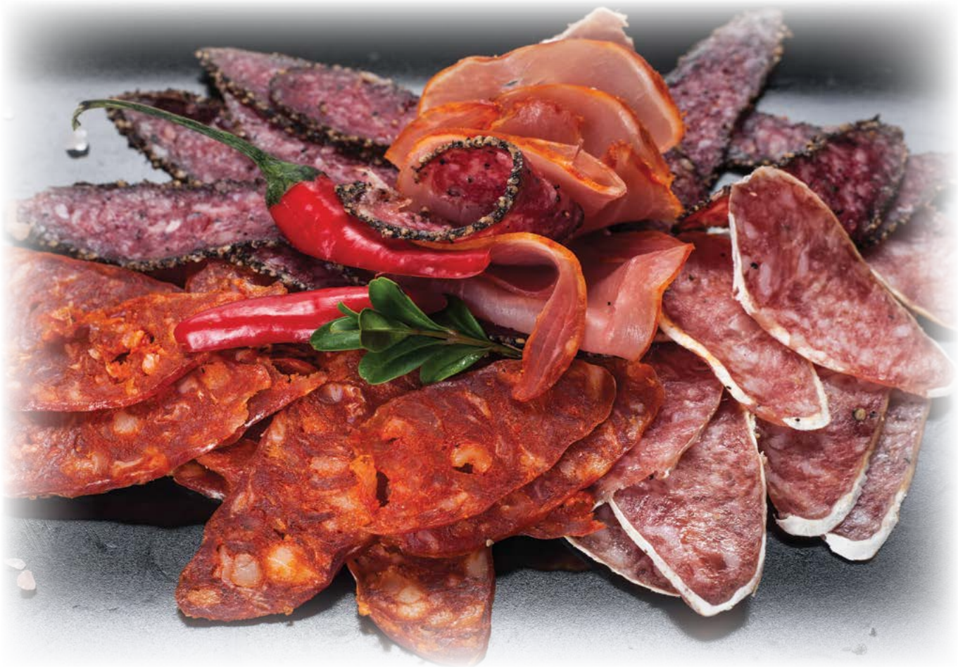
Set of dried meat / Ассорти из вяленого мяса