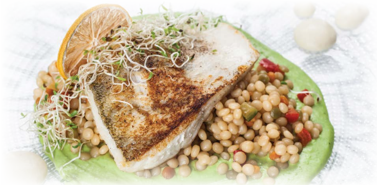
Zander fillet / Филе судака