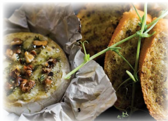
Fried „Camembert“ cheese / Жареный сыр camembert