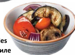
Grill Vegetables Овощи на гриле