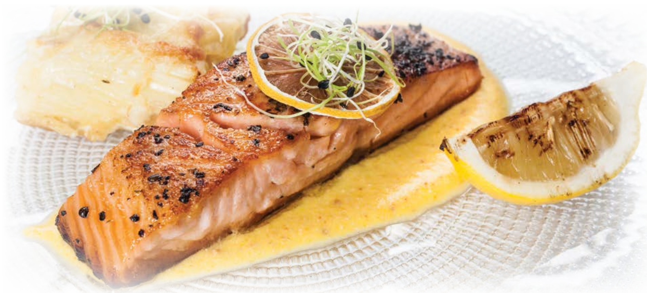
Salmon fillet / Филе лосося

Octopus in Hollandaise sauce 22,50 € Осьминог с голландским соусом