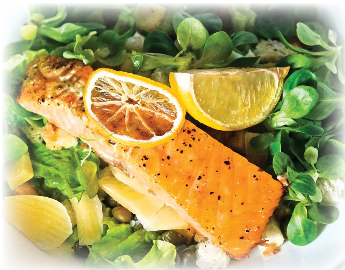
Grilled salmon caesar salad / Салат «Цезарь» с лососем, запеченным на гриле

A mixture of lettuce leaves, tiger shrimps, avocado, mango, plum tomatoes. Topped with a grainy mustard sauce / Листья разных сортов салата, тигровые креветки, авокадо, манго, сливовые помидоры, с соусом из зернистой горчицы